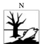
Peligroso para el medio ambiente

Instituto Nacional de Toxicología: Tel.: 915620420